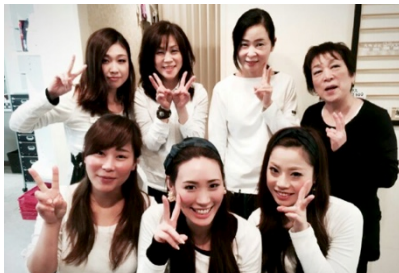
常駐スタッフです♪

〒650-0012 神戸市中央区北長狭通2丁目1番14号 玉廣ビル6階 ヘアセット専門店 : 078-391-2855 ドレス&着物レンタル/着付 専門店 : 078-392-1307