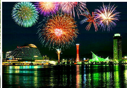
花火大会、夏祭りはWITHで♪