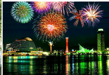
花火大会、夏祭りはWITHで♪