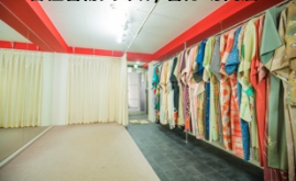
各種着物レンタル/着付 専門店

両専門店は、同一フロアで展開していますので、ヘアセット、メイク、着付けまでトータルでプロデュースさせていただきます!